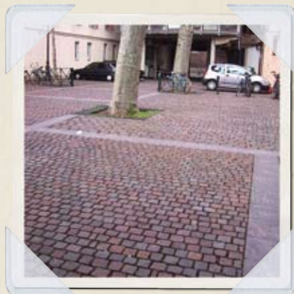
Pelouse de pavés.

Prolifère sur les trottoirs et dans les zones piétonnes. Le pavé est une des plantes préférées des Zurbains. Un temps passé de mode, il revient en force dans les rues, en remplacement de l'asphalte. Sa racine trapue ne s'installe bien qu'en sol sablonneux. Cette particularité a donné lieu à une légende urbaine laissant à penser que, sous les pavés, se trouvait une plage.